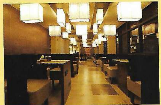
OLEN - CANTO @ MANJERI

റസ്റ്റോറന്റ് & ബേക്കറി രംഗത്തെ പ്രമുഖരായ ഒലീൻ കാന്റോ എന്നെ സമീപിച്ചതും ഒരു വ്യത്യസ്തമായ റെസ്റ്റോറന്റ് & ബേക്കറി ഒട്ട്ലെറ്റ് തുടങ്ങാനായിരുന്നു. തിരക്കേറിയ നഗരത്തിന്റെ ഹൃദയഭാഗത്ത് വലിയ ഒരു റസ്റ്റോറന്റ് ഏറെ ശ്രമകരമായൊരു ടാസ്കായിരുന്നു. ബസ് ടെർമിനലിനോട് ചേർന്നു